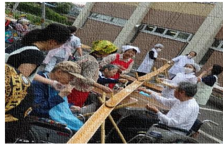
毎年恒例の（流しソーメン） 食べるのに夢中で～す！