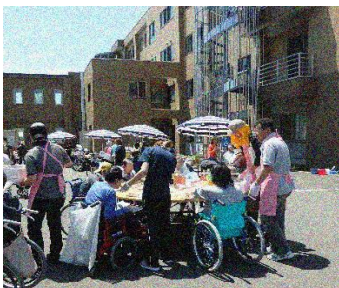
（お茶会）で食べた 桜餅は美味しかったですね。